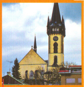
kostel sv. Jana Křtitele ve Dvoře Králové nad Labem

Byl objeven 16. září 1817 VACLAVEM HANKOU ve věžní kobce děkanského kostela sv. Jana Křtitele VE DVŮRE KRÁLOVÉ . Skládá se ze 7 PERGAMENOVÝCH DVOJLISTŮ popsaných po obou stranách, 2 listy jsou neúplné a ze tří čtvrtin odříznuté, takže rukopis tvoří 24 CELÝCH STRAN a 4 „proužky“. Listy jsou přibližně stejně velké – jsou vysoké asi 12 centimetrů a široké 7 – 8 centimetrů. Proužky mají šířku 2 centimetry. Počet řádek kolísá mezi 31 – 33 řádky na 1 stranu.