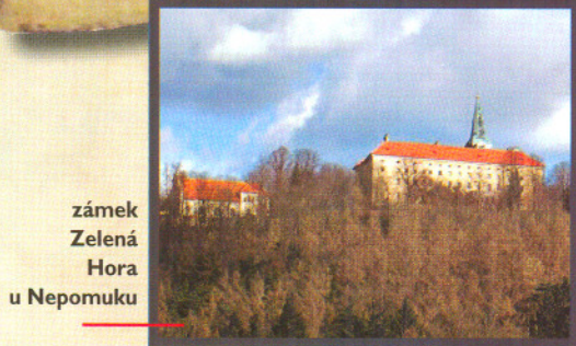
zámek Zelená Hora u Nepomuku

Až po dlouhých 12 letech zjišťuje slovínský badatel DAVORIN ŽUN-