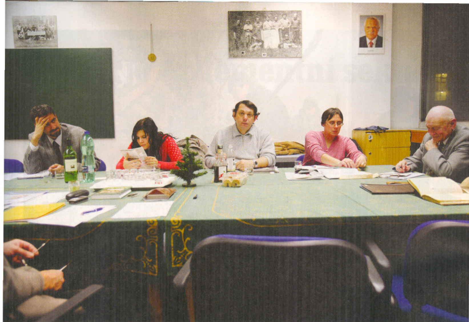
Očistíme české vlastence. (V pořadí 146. porada České společnosti rukopisné)