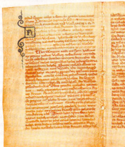
Napsali to pěkně. (Rukopis zelenohorský)

V každé učebnici je napsáno, že Rukopisy královédvorský a zelenohorský jsou padělky. Většina z nás na existenci těchto ikon místních vlastenců, kteří s jejich pomocí dokazovali, že český jazyk má tisícileté kořeny, zapomněla v momentě, kdy se ve škole uzavřela kapitola o národním obrození. Pro mimořádně trpělivé členy České společnosti rukopisné to ovšem tímto okamžikem teprve začalo. A pokračuje dodnes: vystavení posměchu se pokoušejí oživit tezi, že slavná díla nevznikla před 200 lety rukou šikovných padělatelů, ale že je tady máme minimálně od středověku. Je to marný boj, naděje nadšenců jsou však velké. Teď se upínají k nekonečným možnostem vědy, která nabízí mikroskopické zkoumání částic železa v inkoustu, jímž jsou rukopisy napsány. Historici to berou s rezervou a Národní muzeum rovnou odmítá rukopisy pro nové pokusy vydat.